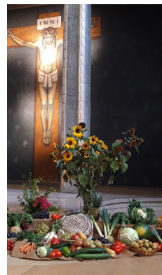
Erntedank Pauluskirche; Bild: Peter Heiter