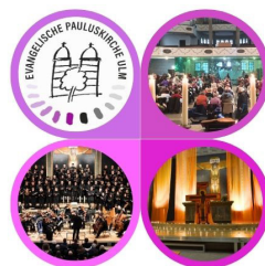
... damit weiter Gutes drin ist! Außensanierung der Pauluskirche